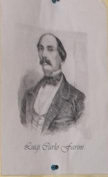
Luigi Carlo Farini

el 1865. la si laurea dogma la ricerca. e la libertà del 1862 no Ministero Consiglio. la nascita venuta a e si ha mostra